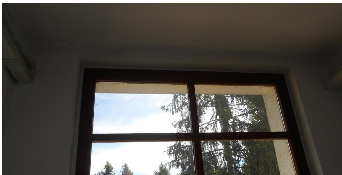
Slika šte. 9: fotografije razpok od vogala okna v nadstropju čelne stene

Teraco tlak hodnika v pritličju in nadstropju je razpokan, predvsem v prečni smeri a tudi po sredi vzdolžno po celi dolžini hodnika, kar je spričo nedilatiranosti pričakovano. Te poškodbe, ki načeloma niso konstrukcijske, v nadaljevanju niso obravnavane (lahko pa se jih sanira z urezovanjem dilatacij in polnitvijo s trajno elastičnimi kiti).