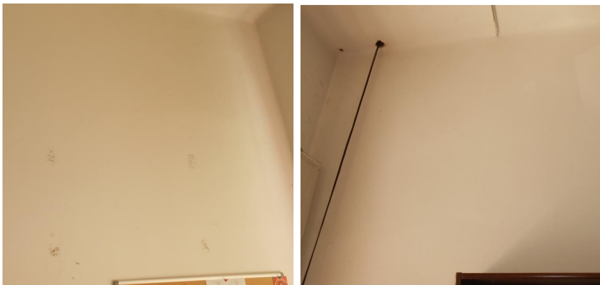
Slika šte. 8: fotografiji poševnih strižnih razpok zidov