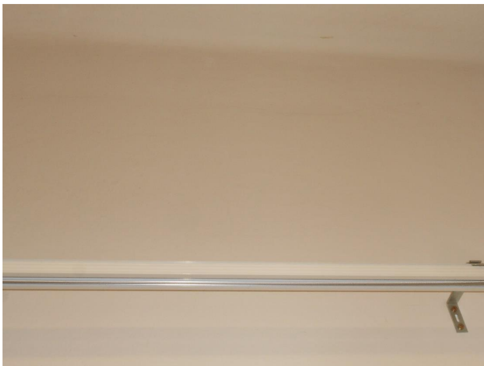
Slika števil. 7: vodoravna razpoka na stiku naknadne pozidave pod nosilcem bivšega stebrišča v pritličju

V notranjosti so mestoma na stikih pozidav bivšega stebrišča na SV strani objekta vidne tanjše razpoke, in sicer predvsem v hodniku na stiku z zgornjimi nosilci (slika števil. 7).